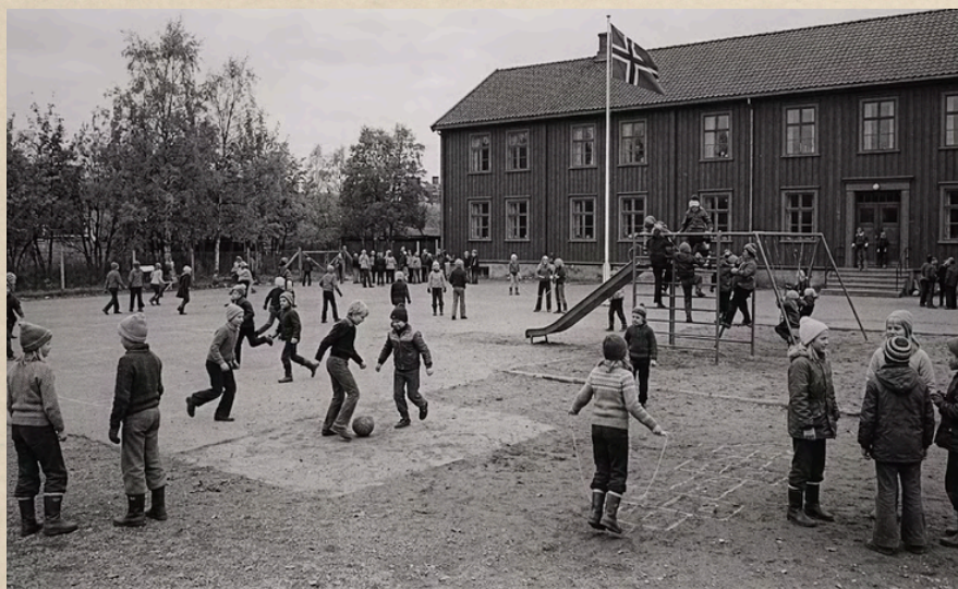
SÅNN SOM DETTE MENER KI AT EN SKOLEGÅRD KUNNE SETT UT SOM FOR 50 ÅR SIDEN