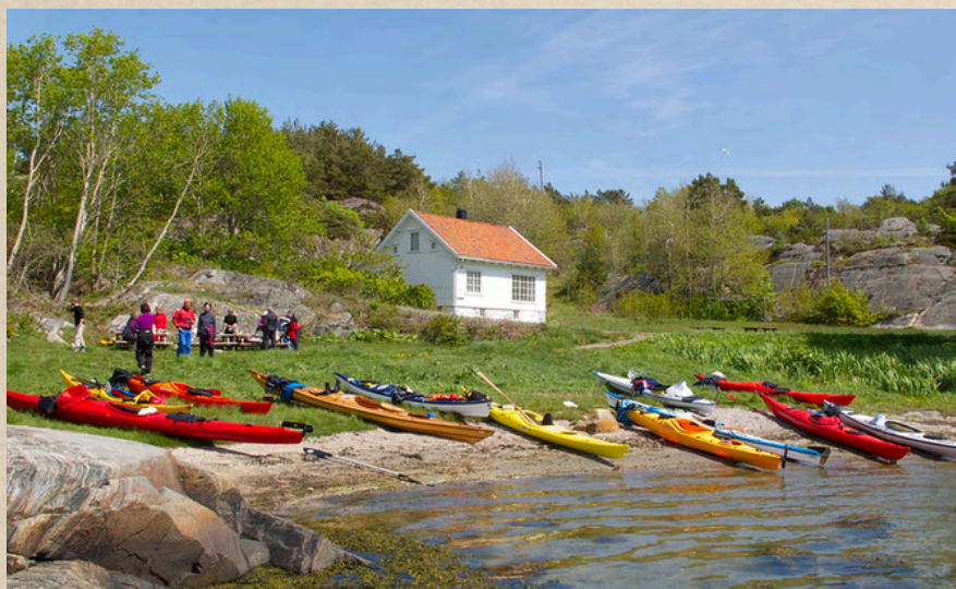
KANOENE OG KAJAKKENE BLE MYE BRUKT MENS VI VAR PÅ LEIRSKOLE. DET BLE OGSÅ MYE BADING.