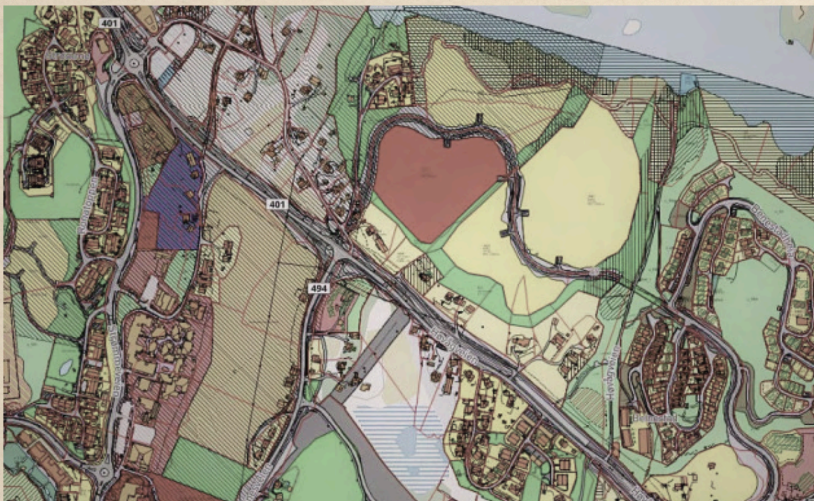
HER SER VI HVORFOR DEN NYE SKOLETOMTEN KALLES HJERTETOMTEN.

Ny skole, nye folk og nytt område. Dette er et av de største byggeprosjektene i Kristiansand i 2028. Veldig mange gleder seg til denne nye skolen og det blir en ny opplevelse for mange barn og en helt ny skole i lokalmiljøet.